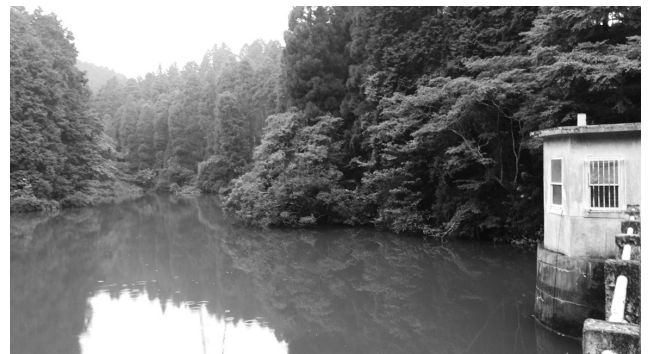
静かな佇まいの水呑ダム